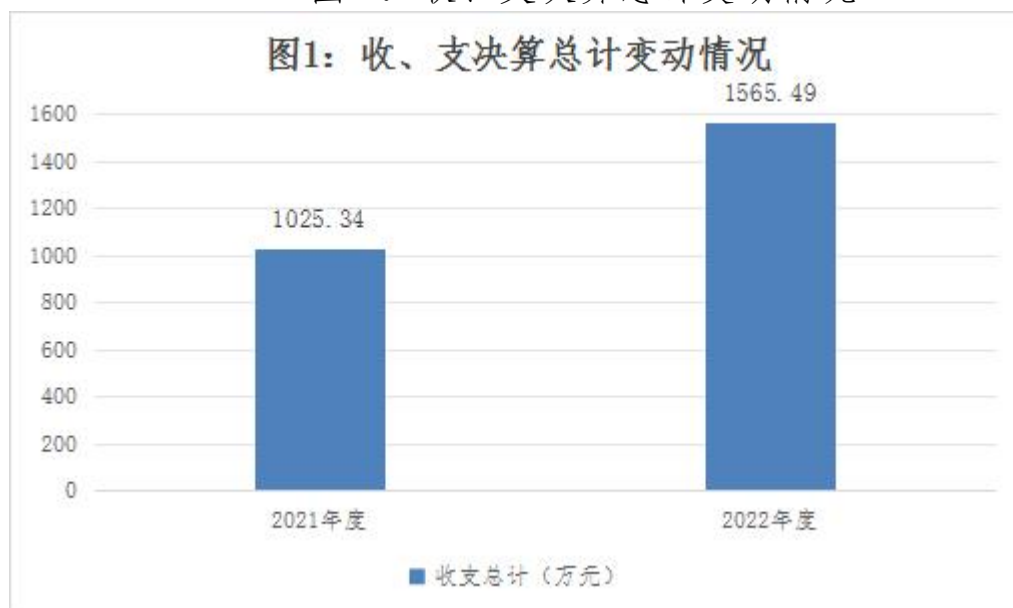
图 1：收、支决算总计变动情况

2022 年度收、支总计 1565.49 万元。与 2021 年度相比，收、支总计各增加 540.15 万元，增长 52.7%，主要原因是在职和退休人员人数发生变动以及按财政要求调整 2021 年预拨转列支。