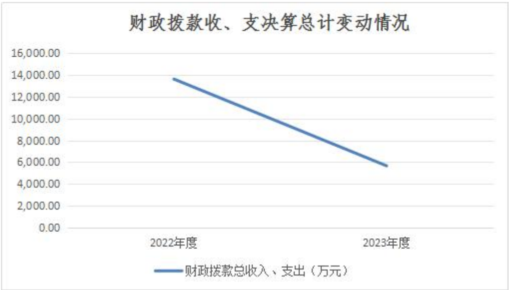
图 4：财政拨款收、支决算总计变动情况

2023年度一般公共预算财政拨款支出4,288.81万元，占本年支出合计的75.7%。与2022年度相比，一般公共预算财政拨