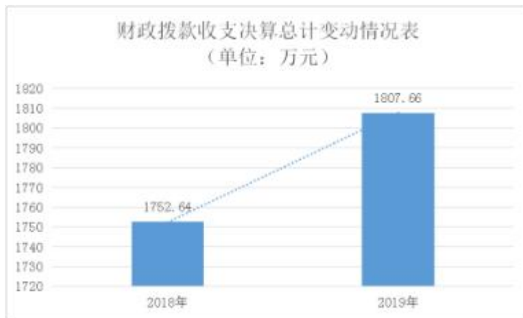
图 4：财政拨款收、支决算总计变动情况

2019 年度财政拨款收、支总计 1,807.66 万元。与 2018 年相比，财政拨款收、支总计各增加(减少) 55.02 万元，增长 3.14%。主要原因是学生人数增加，公用经费增加及人员经费逐年增加。