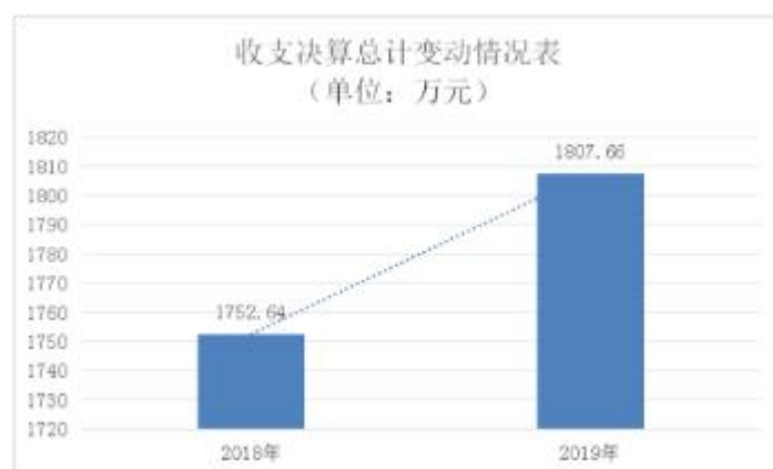
图 1：收、支决算总计变动情况

2019 年度收、支总计 1,807.66 万元。与 2018 年相比，收、支总计各增加 55.02 万元，增长 3.14%。主要原因是学生人数增加，公用经费增加及人员经费逐年增加。