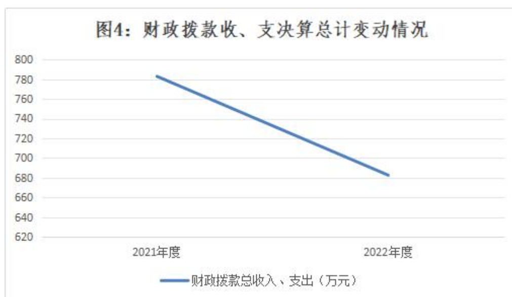
图 4：财政拨款收、支决算总计变动情况

2022 年度财政拨款收入中，一般公共预算财政拨款收入 682.49 万元，比 2021 年度决算数减少 100.41 万元。减少主要原因是 1. 2021 年度考核性绩效全额发放，2022 年为人均预发 8 万元，总额减少。2. 改革性补贴计提基数调低造成人员经费减少。政府性基金预算财政拨款收入 0.00 万元。国有资本经营预算财政拨款收入 0.00 万元。