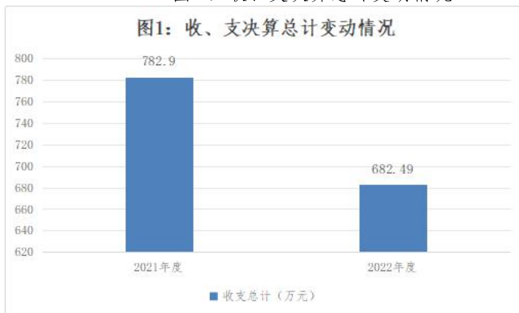
图 1：收、支决算总计变动情况

2022 年度收、支总计 682.49 万元。与 2021 年度相比，收、支总计各减少 100.41 万元，下降 12.8%，主要原因是：1. 2021 年度考核性绩效全额发放，2022 年为人均预发 8 万元，总额减少。2. 改革性补贴计提基数调低造成人员经费减少。