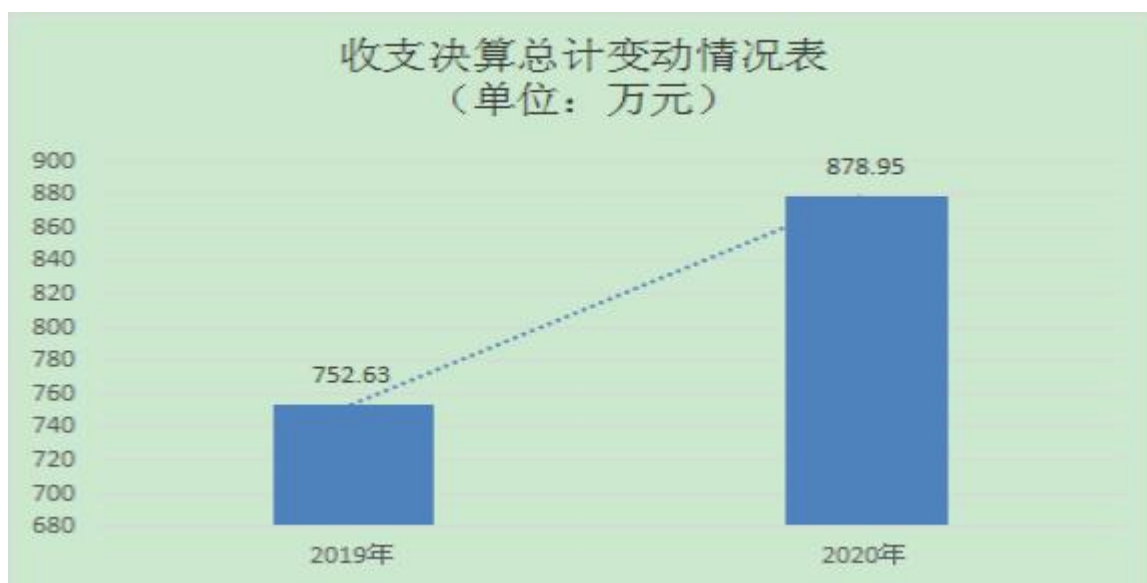
图 1：收、支决算总计变动情况

2020 年度收、支总计 878.95 万元。与 2019 年度相比，收、支总计各增加 126.32 万元，增长 16.8%，主要原因是增加市级优质均衡发展专项资金用于校园维修维护，及职工五奖增补部分等原因。