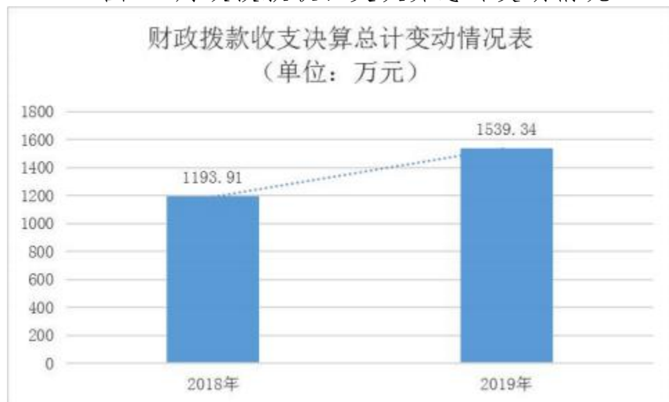
图4：财政拨款收、支决算总计变动情况

2019年度财政拨款收、支总计1,539.34万元。与2018年相比，财政拨款收、支总计各增加 345.38万元，增长 28.93%。主要原因是学生公用经费增加，学校进行新改扩建学校建设；工资增长，教师工资待遇提高。