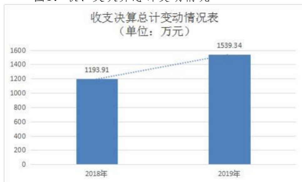
图1：收、支决算总计变动情况

2019年度收、支总计1,539.34万元。与2018年相比，收、支总计各增加345.38万元，增长28.93%，主要原因是学生公用经费增加，学校进行新改扩建学校建设；工资增长，教师工资待遇提高。