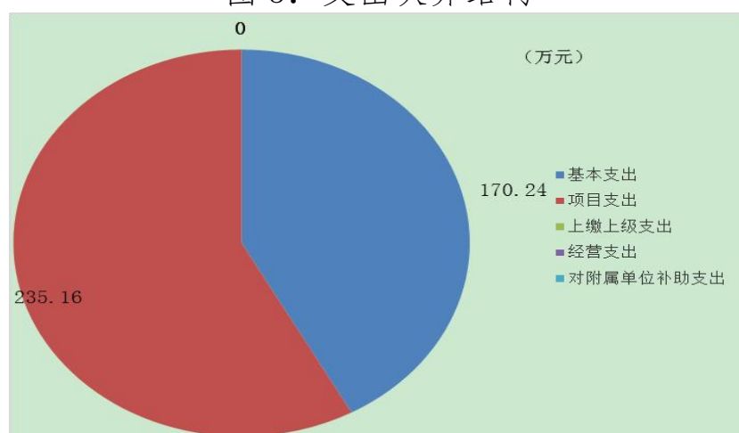
图 3: 支出决算结构

2023 年度支出合计 405.4 万元，与 2022 年度相比，支出合计增加 405.4 万元，增长 100%。其中：基本支出 170.24 万元，占本年支出 41.99%；项目支出 235.16 万元，占本年支出 58.01%。