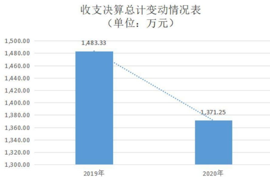
图1：收、支决算总计变动情况（单位：万元）

2020年度收、支总计1,371.25万元。与2019年度相比，收、支总计各减少112.08万元，下降7.6%，主要原因是2020年事业单位绩效工资参照公务员补差额，人年平均补工资1.01万元及人员工资考核加薪增加。