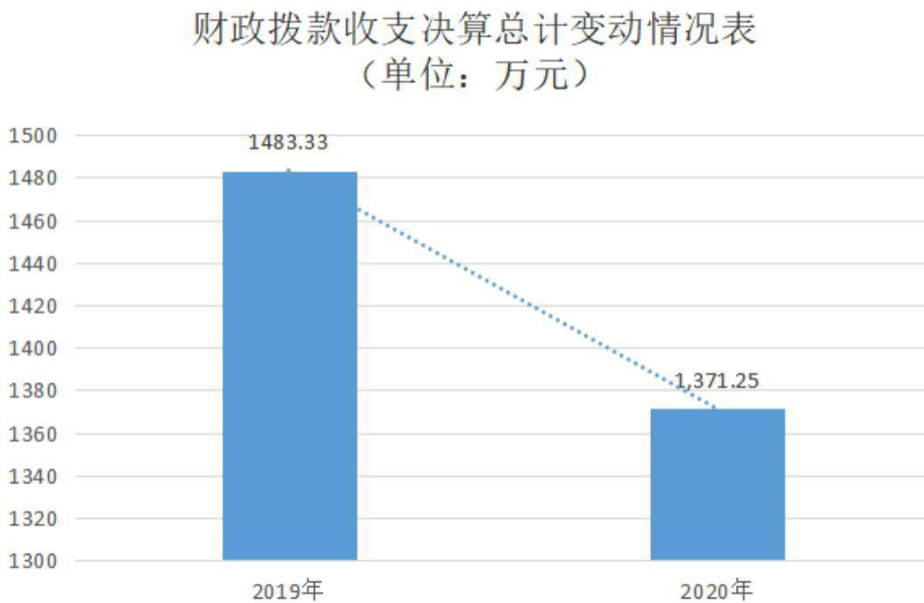
图 4：财政拨款收、支决算总计变动情况（单位：万元）

2020 年度财政拨款收、支总计 1,371.25 万元。与 2019 年度相比，财政拨款收、支总计各减少 112.08 万元，下降 7.6%。主要原因是 2020 年事业单位绩效工资参照公务员补差额，人年平均补工资 1.01 万元及人员工资考核加薪增加。