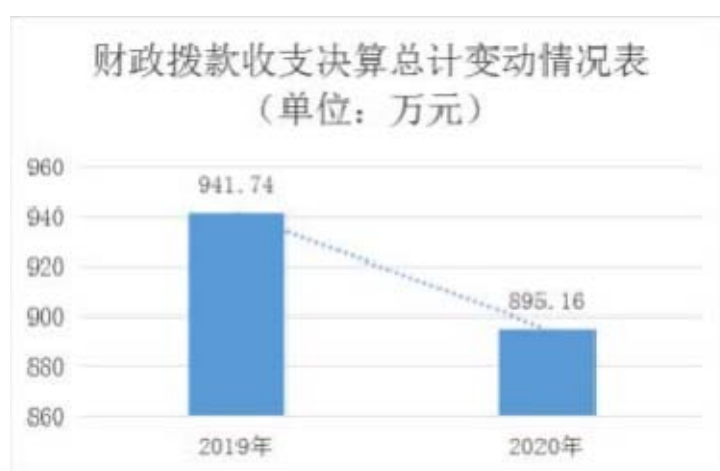
图 4：财政拨款收、支决算总计变动情况

2020 年度财政拨款收、支总计 895.16 万元。与 2019 年度相比，财政拨款收、支总计各减少 46.58 万元，下降 4.95%。主要原因是学校附近拆迁，学生人数减少。