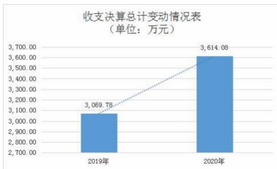
图 1: 收、支决算总计变动情况

2020 年度收、支总计 3,614.08 万元。与 2019 年度相比, 收、支总计各增加 544.30 万元, 增长 17.73% , 主要原因是 2020 年进行了工资的调整。