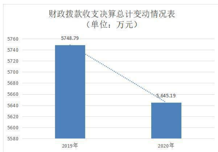
图 4：财政拨款收、支决算总计变动情况（单位：万元）