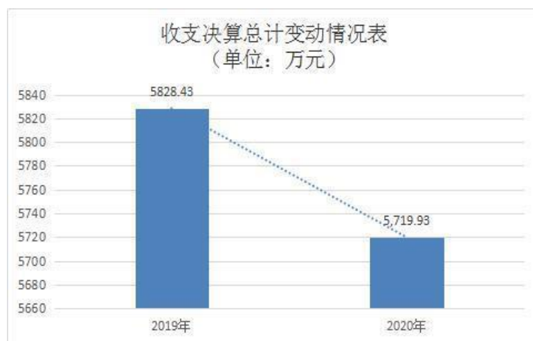
图 1：收、支决算总计变动情况（单位：万元）

2020 年度收、支总计 5,719.93 万元。与 2019 年度相比，收、支总计各减少 108.5 万元，下降 1.9%，主要原因是疫情导致部分项目延期。