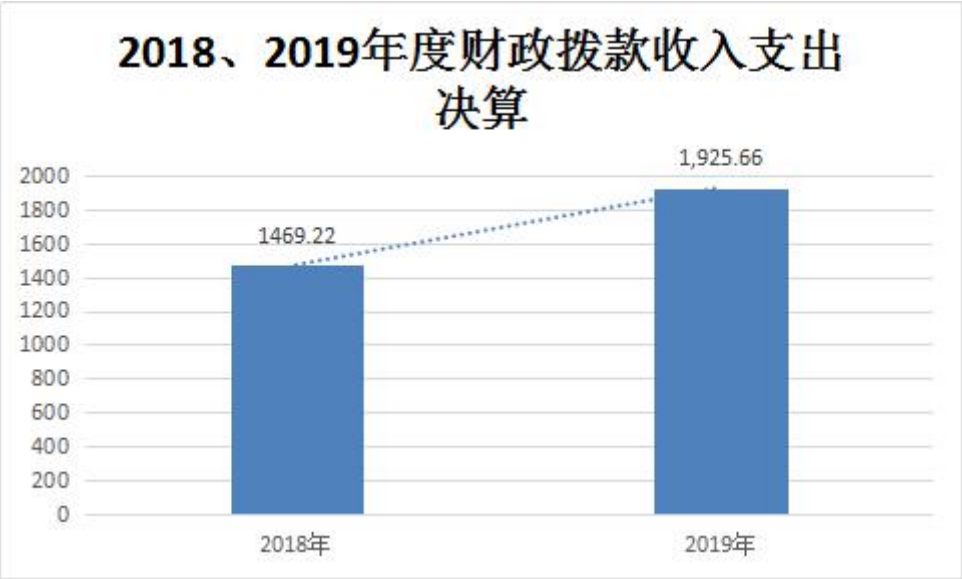
图 1：收、支决算总计变动情况(略)

2019 年度本年收入合计 1,925.66 万元。其中：财政拨款收入 1,925.66 万元，占本年收入 100.00%；上级补助收入 0.00 万元，占本年收入 0.00%；事业收入 0.00 万元，占本年收入 0.00%；经营收入 0.00 万元，占本年收入 0.00%；附属单位上缴收入 0.00 万元，占本年收入 0.00%；其他收入 0.00 万元，占本年收入 0.00%。