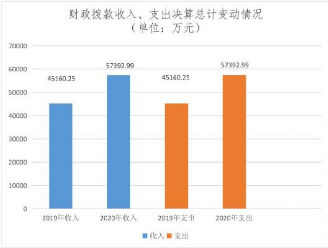
图 4：财政拨款收入、支出决算总计变动情况

2020 年度财政拨款支出 49771.00 万元， 占本年支出合计的 86.72%。与 2019 年相比，财政拨款支出增加 4759.75 万元，增长 10.6%。主要原因：一是疫情期间车辆保障、方舱隔离点的建设、拆除及运行费用、防控人员的工作补助的经费增支；二是防汛经费的增支。