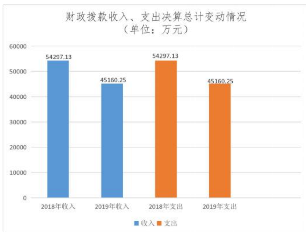
图 4：财政拨款收入、支出决算总计变动情况

2019 年度财政拨款收、支总计 45160.25 万元。与 2018 年相比，财政拨款收、支总计各减少 9136.88 万元，下降 16.83%。主要原因是军运会专项整治经费的减少。