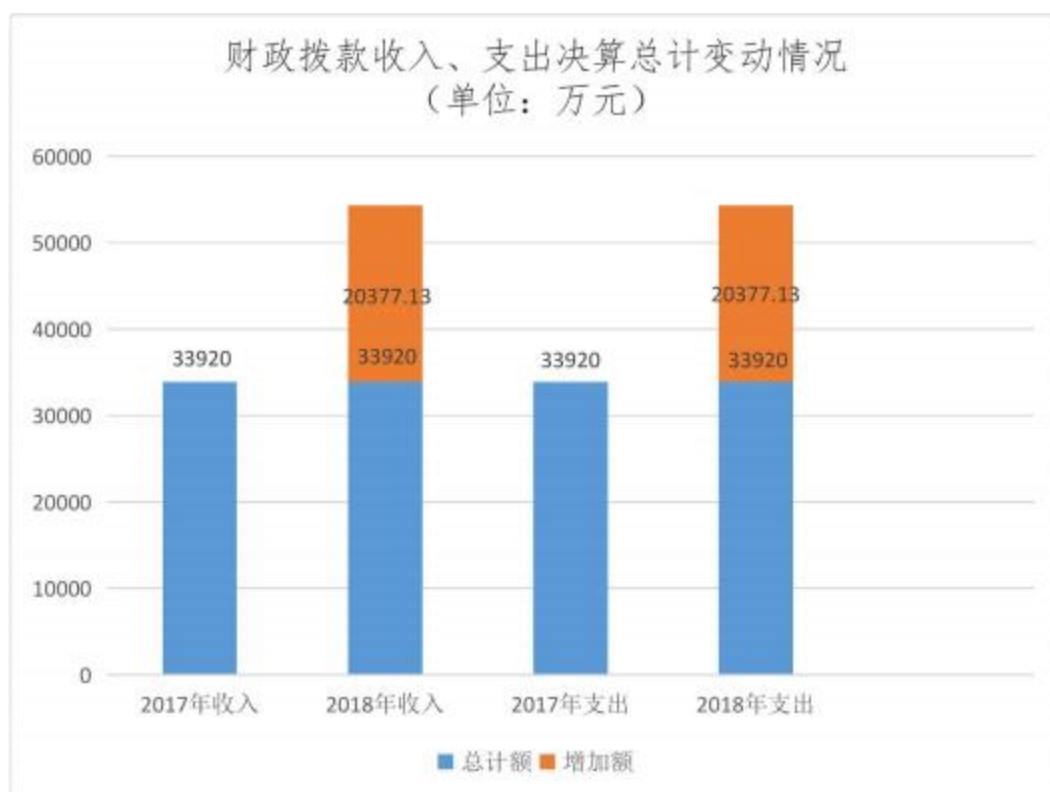
图 4：财政拨款收入、支出决算总计变动情况