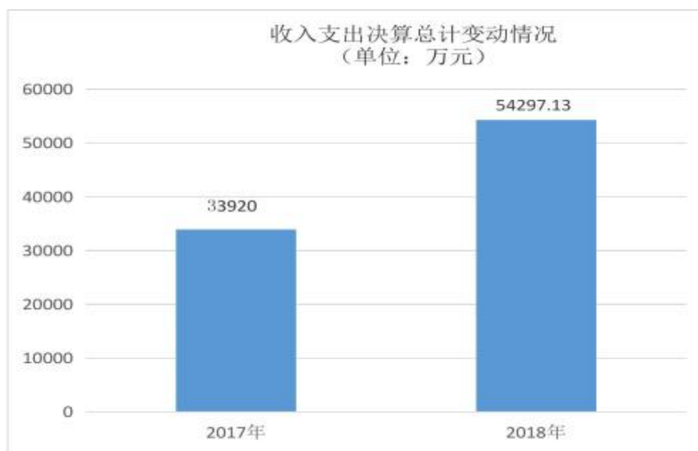
图 1：收入支出决算总计变动情况表

2018 年度收、支总计 54297.13 万元(含本级 23996.13 万元，二级单位 30301.00 万元)。与 2017 年相比，收、支总计各增加 20377.13 万元，增长 60.07%，主要原因：一是人员工资福利增加；二是项目经费增加；三是政府性基金增加；四是军运会专项整治经费的增加。