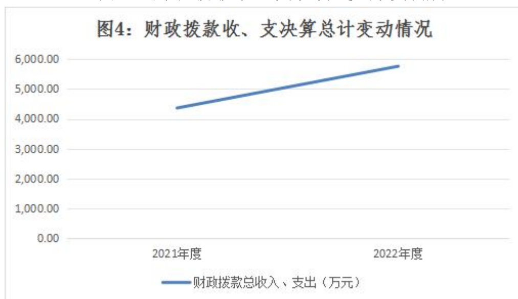
图 4：财政拨款收、支决算总计变动情况

2022 年度财政拨款收入中，一般公共预算财政拨款收入 5,762.37 万元，比 2021 年度决算数增加 1448.31 万元。增加主要原因是疫情防控经费增加，往年预拨经费调整。政府性基金预算财政拨款收入 0 万元，比 2021 年度决算数减少 47.52 万元。减少主要原因是本年度无政府性基金预算财政拨款收入。国有资本经营预算财政拨款收入 0 万元，比 2021 年度决算数持平。