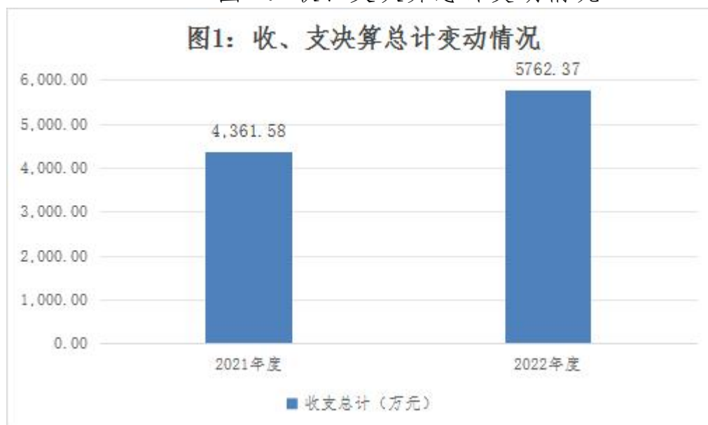
图 1：收、支决算总计变动情况