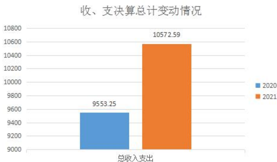
图 1: 收、支决算总计变动情况

2021 年度收、支总计 10,572.59 万元。与 2020 年度相比, 收、支总计各减少-1,019.34 万元, 下降-8.8%, 主要原因是 2021 年度五奖部分金额属于预拨经费, 未在本年度决算中反映。