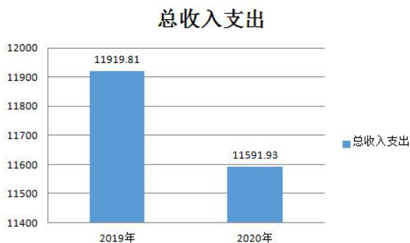
图 4 财政拨款收、支决算总计变动情况