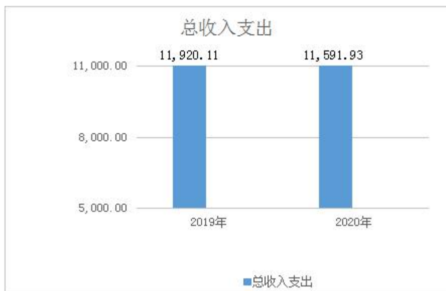
图 1 收入支出总体情况

2020 年度收、支总计 11,591.93 万元。与 2019 年度相比，收、支总计各减少 328.18 万元，下降 2.75%，主要原因是一是部门厉行节约，压减经费；二是受疫情影响市场关闭，工作未能全面开展。